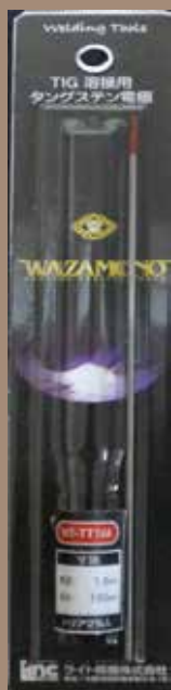
1 本入 (BP) 190mmx35mm