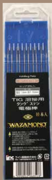
10 本入 (ケース) 210mmx55mm